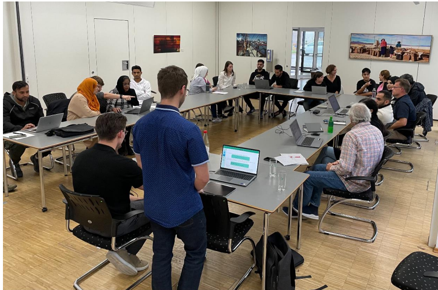
Computerkurse für Flüchtlinge