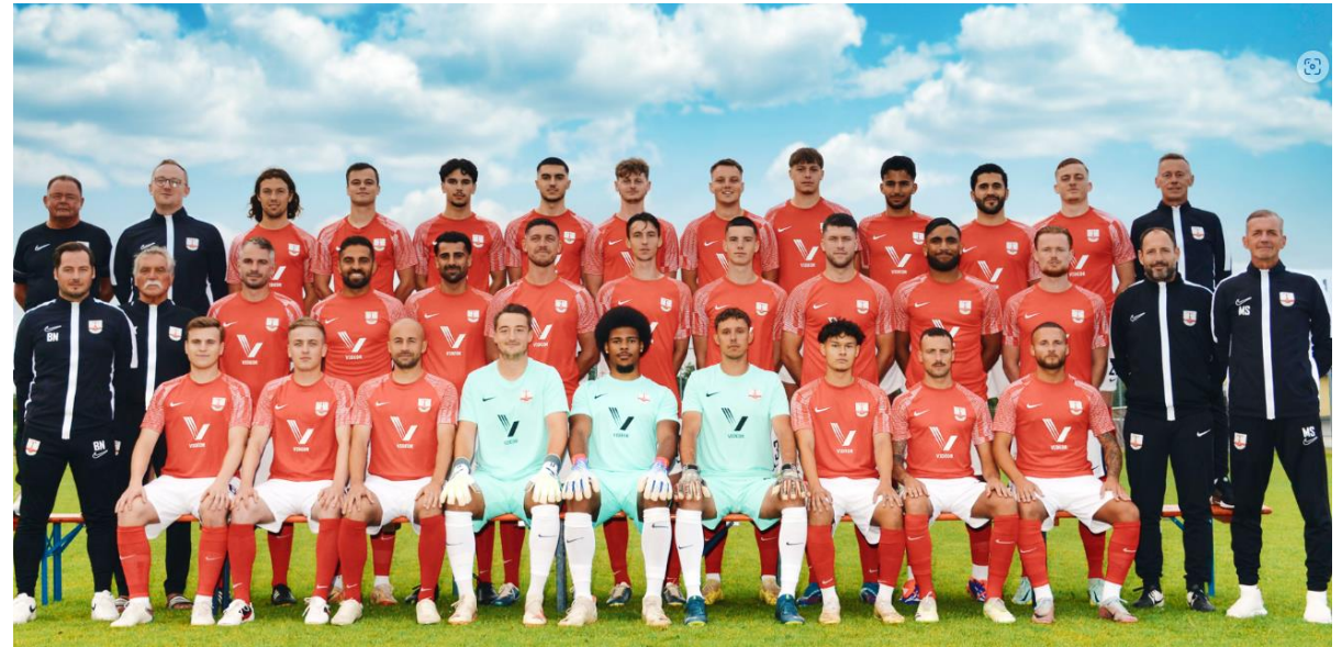
Sponsoring und Zusammenarbeit mit dem lokalen Sportverein