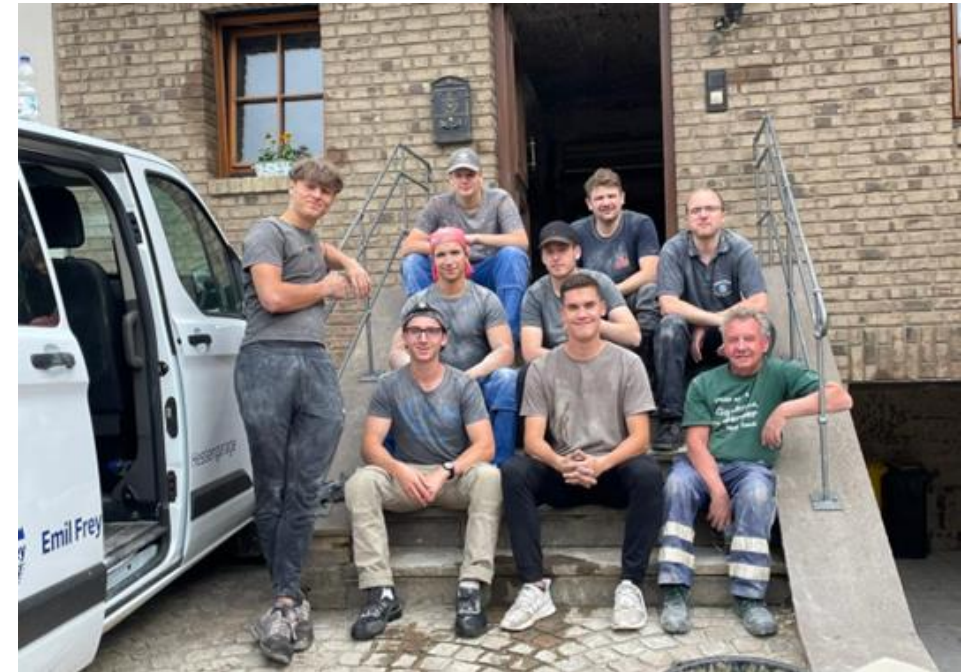
Freistellung fürs Ehrenamt (Ahrtal Flut)