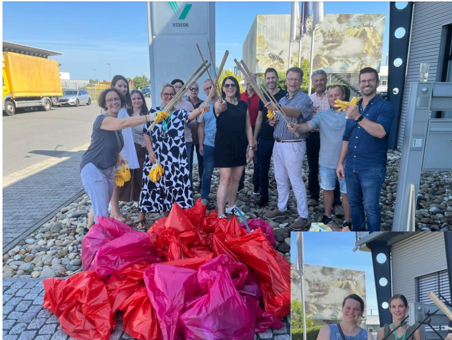
Müllsammelaktion im Wald und im Industriegebiet