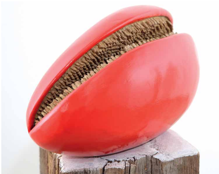
Fülöp Gábor: Urushi III.